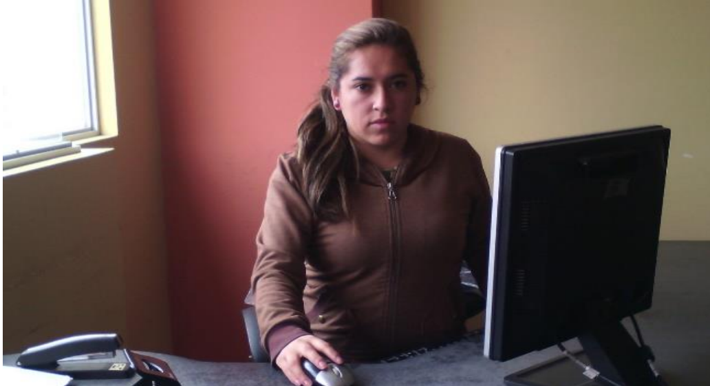
SECRETARIA – TESORERA

Actualmente Secretaria – Tesorera del Gad. Parroquial Cochapamba